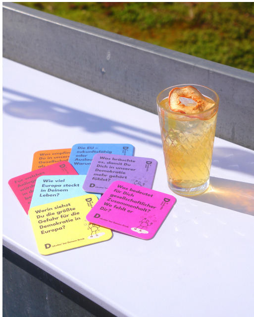
WDC-Drink The Companion