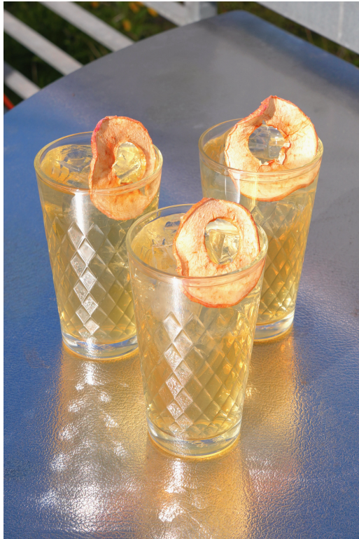
WDC-Drink The Companion